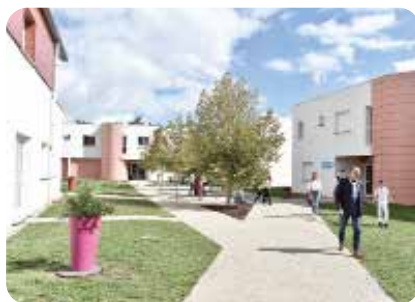
Le village de Bourges