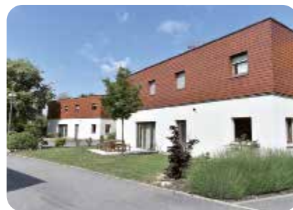
Le village de Nancy

Pour être au plus près des familles, trois villages ont été progressivement mis en service depuis le début des années 2000 : à Agde (Hérault), à Bourges (Cher) et à Nancy (Meurthe-et-Moselle).