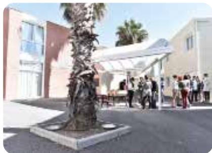
Le village d'Agde

Dans le cadre de l'accompagnement matériel et éducatif des orphelins de policiers, les villages Orphéopolis se situent au cœur du dispositif d'action sociale. Ils ont pour objectif de proposer, aux familles qui le souhaitent, une prise en charge éducative et morale transitoire de leurs enfants afin de les aider à surmonter les difficultés auxquelles ils sont confrontés, mais aussi de favoriser la poursuite d'études supérieures des jeunes majeurs. Selon les places disponibles, nos villages peuvent également accueillir des enfants de policiers adhérents en difficulté.